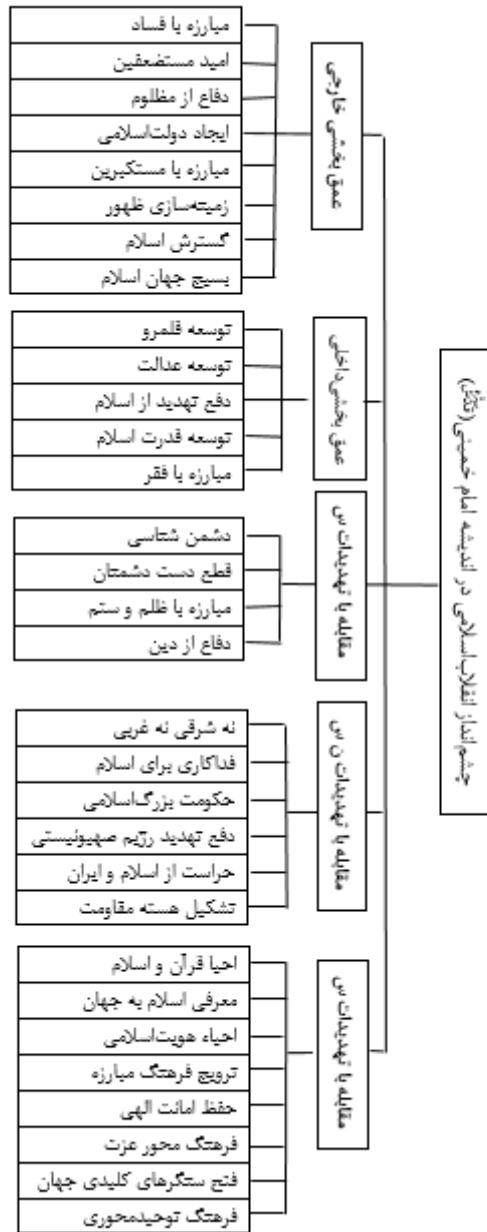
نمودار ۱. شبکه مضمونی چشم انداز انقلاب اسلامی در اندیشه سیاسی امام خمینی (ره)