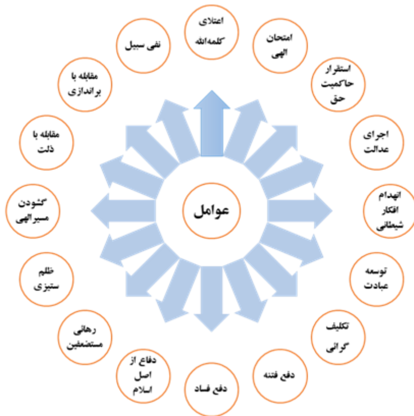
شکل ۱. مدل مفهومی عوامل مؤثر در شکل‌گیری جنگ از منظر مبانی ارزشی و آموزه‌های دینی (نگارنده: ۱۳۹۸)

از عوامل شانزده‌گانه مستخرجه از مبانی ارزشی و آموزه‌های دینی مؤثر در شکل‌گیری جنگ اعم از جنگ پیشگیرانه، پیش‌دستانه و دفاع در جنگ تحمیلی این واقعیت قابل استنباط است که شکل‌گیری پدیده جنگ در مکتب سعادت بخش اسلام ناب با سایر مکاتب دینی تحریفی و مادی تفاوت ماهوی دارد. عوامل شانزده‌گانه فوق، مضاف بر منطبق‌بودن با فطرت انسان، و تبیین اصول و قواعد رزم برای فرماندهان و رزمندگان صحنه نبرد است که حضرت امام(ره) چنین تبیین فرمودند: «...می‌گوید مراکز نظامی عراق را، و یک بمب در شهرهای عراق