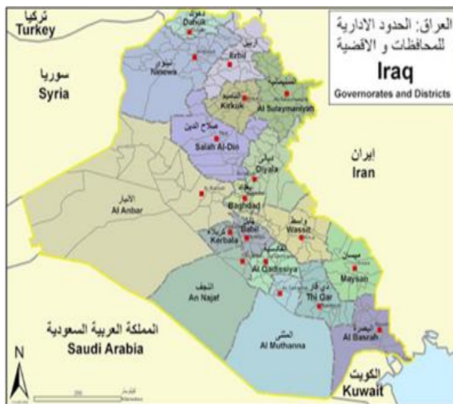
شکل ۱. نقشه کشور عراق

آنچه در نقشه نمایان است، شیعیان در شهرهای دیگری چون بابل، ذی قار، دیالی، میسان، نینوی، قادسیه و واسط نیز سکونت دارند. ترکمن‌های شیعه مذهب عراق که حدود ۱۰ درصد جمعیت عراق را تشکیل می‌دهند در میان مناطق کوهستانی شمال عراق و مناطق مرزی سوریه و ایران در شهرهای موصل، اربیل، آلتون کپری، کرکوک، دهوک، طوزخورماتو، کفری، خانقین و برخی نواحی کوهستانی سکونت دارند. شیعیان فیلی عراق در خانقین و محلات مختلف بغداد مانند رصافه و صدریه، و باب‌الشیخ و شورجه سکونت دارند (الخیون، ۲۰۰۵م: ۴۴۵) شیعیان «شبک» در موصل و جلگه نینوا حضور و فعالیت دارند. گرچه در برخی منابع تحقیقی شیعیان شبک از گروه غلات، سنی شافعی و سایر مذاهب قلمداد کرده‌اند، ولی این گروه مذهب و ماسک شیعی دارند.