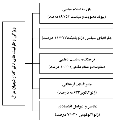
جدول ۳. مدل نهایی پژوهش