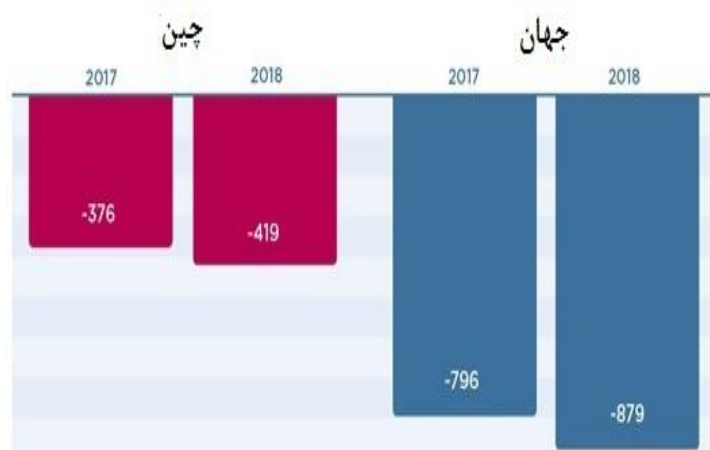
نمودار ۳. افزایش کسری تجاری آمریکا با چین و جهان

در صورت تداوم تحریم‌ها، نفت این کشورها تنها به شکلی غیر از شکل مرسوم آن به فروش می‌رسد. نتیجه اینکه در بلندمدت از کارایی تحریم‌ها کاسته خواهد شد و در پی آن، فرصتی برای رقبای آمریکا پیش خواهد آمد تا با استفاده از شرایط به وجود آمده، موقعیت اقتصادی و سیاسی خویش را تقویت کنند. این رقبا به تدریج برخی از معاملات خود را با ارزی غیر از دلار انجام می‌دهند و تلاش می‌کنند تا در آینده، بخش اعظم معاملات بین‌المللی خود را با ارزهای غیردلاری انجام دهند. بنابراین به نظر می‌رسد در سال‌های آینده با حذف ارز دلار از معاملات نفت، موقعیت برتر اقتصاد ایالات متحده تضعیف و در مقابل، موقعیت کشورهای رقیب آمریکا مانند چین تقویت شود. در جدول شماره ۵ به خوبی نشان داده شده که کسری تجاری آمریکا در مقابل چین و دیگر کشورهای جهان در حال افزایش بوده و با گذشت زمان بر آن افزوده می‌شود. این روند نشان از افول اقتصاد هژمونیک آمریکا در جهان دارد.