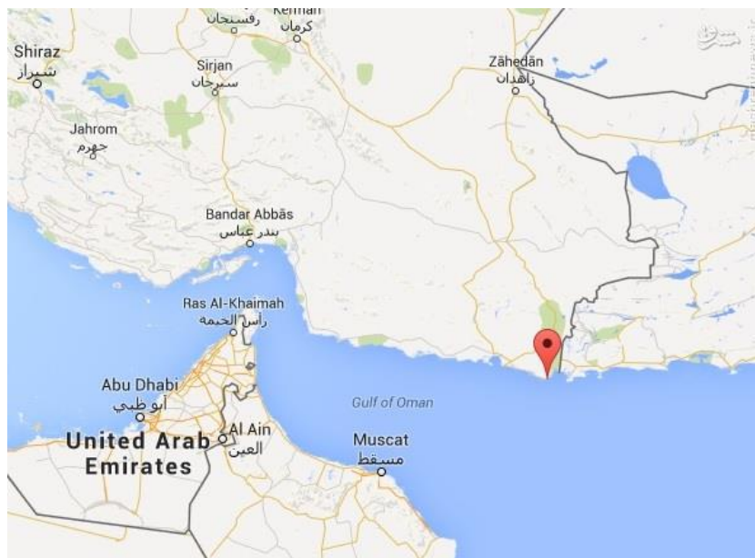
شکل ۱. نقشه مربوط به سواحل خلیج فارس و منطقه مکران جنوبی

یکی از مهم‌ترین قابلیت‌های این منطقه، مجاورت آن با آب‌های آزاد بین‌المللی در سرتاسر مرز جنوبی، همسایگی مستقیم با کشورهای پاکستان و افغانستان و به طور غیرمستقیم با کشورهای آسیای مرکزی (از طریق ترکمنستان) است که یک راه غیرقابل چشم‌پوشی برای این کشورهای محصور در خشکی (به جز پاکستان) به دریاهای آزاد محسوب می‌شود.