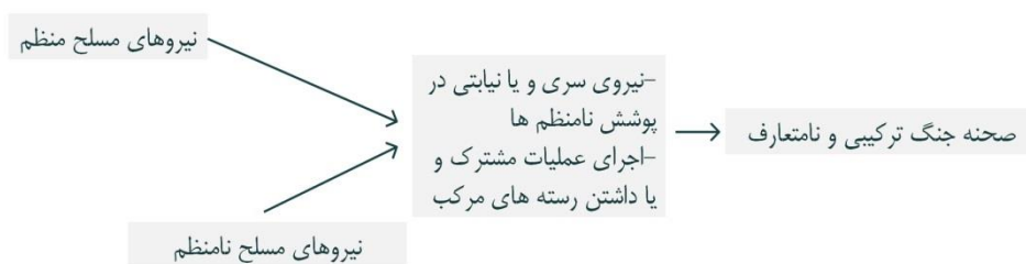
شکل ۴. شمایی از مضمون کلی جنگ ترکیبی و نامتعارف