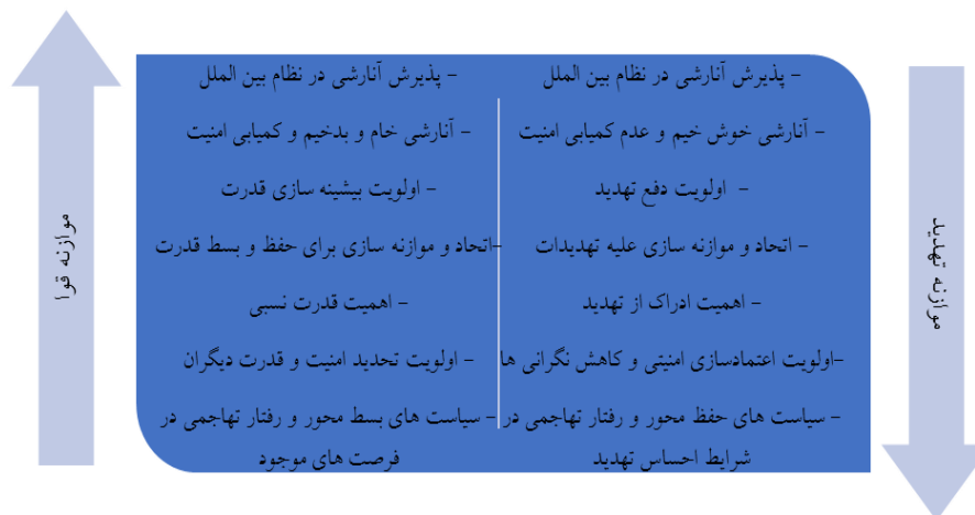
شکل ۱. موازنه قوا و موازنه تهدید در روابط بین الملل

سطح ایجاد موازنه و بازداشتن تهدیدگر است. (مشیرزاده، ۱۳۹۰: ۱۱۴) از دیدگاه استفن والت ۱ ، موضوعی که کشورها را به موازنه سازی ترغیب می کند نه افزایش قدرت بلکه افزایش تهدید است. بدین ترتیب موازنه تهدید ۲ نوعی از موازنه است که معتقد است ائتلاف ها جهت موازنه در قبال تهدیدات شکل می گیرند و نه قدرت. (Person, 2017: 48-50) در واقع، والت به عنوان واضح اصلی نظریه موازنه تهدید معتقد است که دولت ها نه در برابر توانمندیهای دیگر دولت ها، بلکه در برابر تهدیدات خارجی که بر حسب توانمندی ها و ادراک از تهدید شکل می گیرند، دست به موازنه و اقدامهای موازنه ساز می زنند. بنابراین آنچه در روابط میان دولت ها حائز اهمیت است برداشت آنها از یکدیگر به عنوان تهدید است و نه صرف میزان قدرت هر یک از آنها. بدین ترتیب دولت ها در برابر آن دسته از دولت هایی دست به موازنه می زنند که تهدیدی نسبت به موجودیت و یا منافع آنها باشند. در اینجا اقدام های موازنه ساز می توانند در قالب همکاری، اتحاد و یا منطقه گرایی در برابر قدرت و تهدید برون منطقه ای باشند (Nuruzzaman, 2021: 259-260) باید توجه داشت تهدیدات معاصر بسیار متفاوت از گونه های سنتی آن بوده و صرف اتکاء به نظریات و الگوهای «تحلیلی- برآوردی» سنتی دیگر جوابگوی ارزیابی تهدیدات نوین نیست. گستره تهدید، زمان تهدید، عمق تهدید، تکرار تهدید، دامنه تهدید و مکان تهدید از جمله فاکتورهای لازم جهت ارزیابی تهدیدات به شمار می آید. (کاظم پور وبهرامی ۱۳۹۷: ۲-۴)