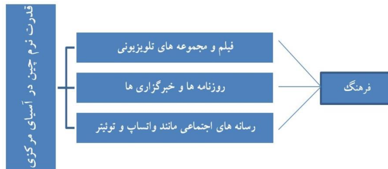
شکل ۱. الگوی نظری پژوهش

بررسی شده است. به عنوان مثال، در مورد مبنای تقسیم بندی رسانه ها در قالب دیپلماسی عمومی و کاربرد آن می توان به دولت ایالات متحده اشاره نمود. در همین ارتباط، ایالات متحده به کاربرد قدرت نرم خود در مناطق مختلف جهان همچون کشورهای عربی به عنوان بخشی از یک برنامه رسمی دیپلماسی عمومی پرداخته است. همچنین در مورد چگونگی مواجهه با چالش ها و استفاده از قدرت نرم بحث شده است (Rugh, 2017: 4). این مطالعه به روشن شدن این سوال گسترده تر کمک می کند که قدرت نرم چین در آسیای مرکزی به چه نحوی بوده و دارای چالش هایی می باشد. استفاده از ابزار تحلیل قدرت نرم از اهمیت ویژه ای برخوردار است، زیرا به ما کمک می کند تا از تغییر قدرت مداوم بهره مند شویم. این موضوع همچنین شامل چگونگی توسعه و حفظ نقش چین در آسیای مرکزی، و نیز کشف چالش های موجود است (Weissmann, 2020: 354). در ادامه الگوی نظری پژوهش با توجه به قدرت نرم چین در آسیای مرکزی ارائه شده است: