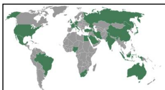
شکل ۱- نقشه جهانی قدرت‌های منطقه‌ای (رنگ تیره)

قدرت منطقه‌ای ۲ : قدرت منطقه‌ای قدرتی است که به یک منطقه‌ی جغرافیایی خاص، تعلق بیشتری داشته و نفوذ نظامی و اقتصادی خود را در آن منطقه گسترش داده است. قدرت‌های منطقه‌ای در منطقه‌ی تحت نفوذ خود نقش رهبری داشته و از سوی همسایگان به‌عنوان رهبر منطقه پذیرفته شده‌اند.