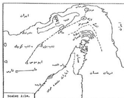
نقشه‌ی شماره‌ی ۲: خط قوس دفاعی ایران در تنگه هرمز

تنگه هرمز به دلیل اهمیت راهبردی به‌عنوان یک نقطه کنترل و اعمال فشار برای قدرت‌های بزرگ مطرح است و کسی که کنترل این تنگه را در اختیار دارد، می‌تواند موازنه قدرت جهانی را به نفع خود تغییر دهد. به دلیل نزدیکی این تنگه به بندرعباس، در صورت از دست رفتن آن، جزایر ایران در منطقه تنگه هرمز، جنوب کشور و به‌خصوص بندرعباس در مقابل تهدیدات خارجی آسیب‌پذیر می‌شود. مهم‌ترین جزایری که بر تنگه هرمز و بندرعباس اشرف دارند، عبارتند از: قشم، هرمز، لارک، هنگام، تنب بزرگ و کوچک و ابوموسی. این جزایر در محدوده استان هرمزگان قرار دارند و به دلیل حاکمیت بر آبراه بین‌المللی تنگه هرمز و کنترل آن و هم‌چنین تأمین امنیت بندرعباس، از ارزش راهبردی بالایی برخوردارند و امکانات خوبی را برای دفاع از کرانه‌های جنوبی ایران فراهم می‌آورند. این جزایر خطوط منحنی دفاعی ایران در خلیج فارس هستند. ترسیم یک خط فرضی که از کنار جزایر مزبور بگذرد و آنها را به هم پیوند دهد، شناخت چگونگی تسلط راهبردی ایران بر راه‌های کشتیرانی در معبر راهبردی هرمز را آسان می‌سازد. (www.ajair.ir)