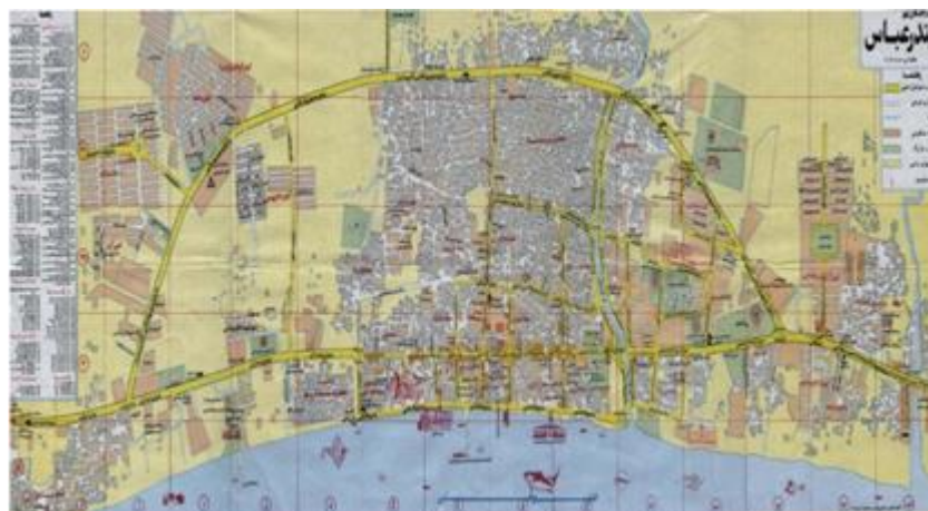
نقشه‌ی شماره‌ی ۱: شهر بندرعباس

ساحلی و در فاصله ۱۴۷۰ کیلومتری جنوب شرقی مرکز کشور "تهران" قرار گرفته است. (سازمان جغرافیایی، ۱۳۸۳، ۵)