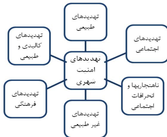
نمودار ۱: تقسیم بندی تهدیدهای امنیت شهری (رضوان، ۱۳۸۵: ۵۲)