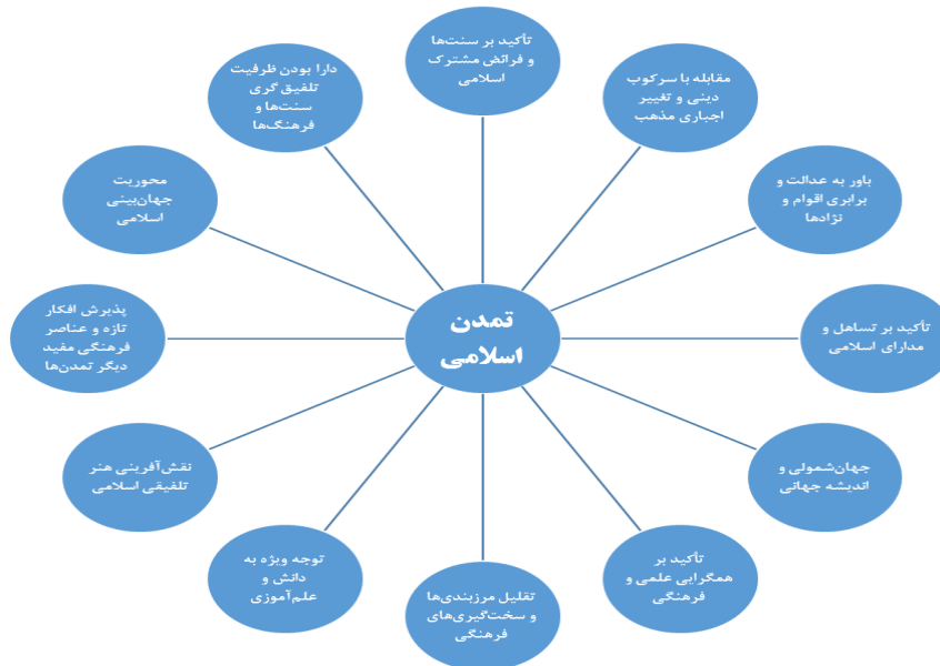
شکل ۱. مؤلفه‌های هم‌افزایی هویتی در تمدن اسلامی

با توجه به مؤلفه‌های هم‌افزایی تمدن اسلامی می‌توان نسبت به باز تعریف هویت مشترک منطقه‌ای و الگوسازی نظم امنیت منطقه‌ای گام برداشت.