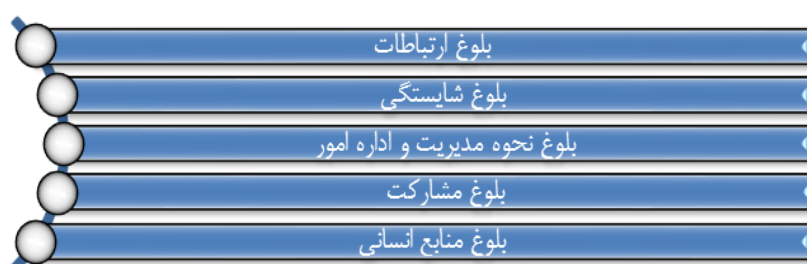
شکل ۲. الگوی یکپارچه‌سازی و هدایت مؤلفه‌های قدرت ملی (مرادیان، ۱۳۹۶)

اگر مردم احساس کنند در معرض آسیب قرار گرفته‌اند، در مورد اینکه آیا بازهم مایل به کمک هستند یا خیر، مسئله اعتماد مطرح می‌شود. کاهش میزان اعتماد متقابل و از بین رفتن حس مشارکت (که فقدان «سرمایه اجتماعی» خوانده می‌شود) به مثابه عنصر ضد بسیج منابع عمل می‌کند. لذا شاید در میان مجموعه ارزش‌های اجتماعی، اعتماد بزرگ‌ترین و بنیادی‌ترین سرمایه اجتماعی است. بقا و دوام یک اجتماع (در سطح خرد یا کلان) نیازمند اعتماد است؛ زیرا اجماع کنشگران در مواجهه با خطر یا بحران، محتاج اعتمادی است که اولاً، آحاد جامعه در روابط متقابلشان نسبت به یکدیگر دارند و ثانیاً، شهروندان در مناسباتشان با نظام سیاسی، برقرار می‌کنند. (مرادیان، ۱۳۹۴: ۷).